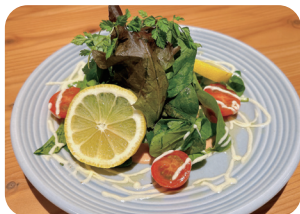
海老とアボカドのタルタル Shrimp and Avocado Tartar ¥800