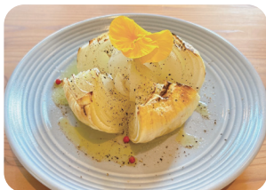
玉ねぎのオープン焼き Oven-Baked Onion ¥800