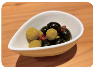
オリーブ Olives ¥300