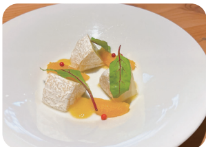
カマンベールチーズ Camembert Cheese with Orange Sauce ¥1,300