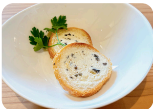
アンチョビチーズ& アルメニット Anchovy Cheese & Armenit ¥600