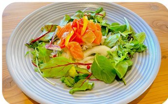
サーモンのマリネ Marinated Salmon ¥900