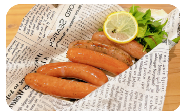
バラエティー粗挽きウィンナー5種 Assorted Coarsely Ground Sausages (5 Types) ¥1,100