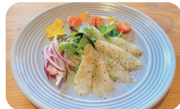
季節の白身魚のカルパッチョ Seasonal white fish carpaccio ¥1,300