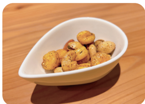
スパイシーミックスナッツ Spicy Mixed Nuts ¥500