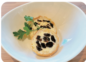
レーズンバター&レパン Butter Raisin Baguette ¥600