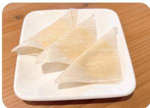
チーとろカマンベールチーズ Creamy Melted Camembert Cheese ¥500