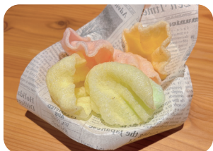
クルコップ Prawn crackers ¥300