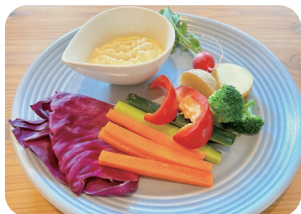
野菜のバーニャカウダ Vegetable Bagna Cauda ¥1,300