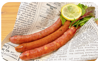
牛タン3種ウィンナー Assorted Beef Tongue Sausages (3 Types) ¥1,100