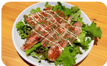
ローストビーフの カルパッチョ Roast Beef Carpaccio ¥1,200