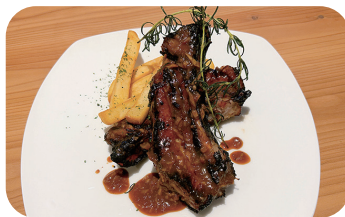
スペアリブポーク Pork Spare Ribs ¥1,600