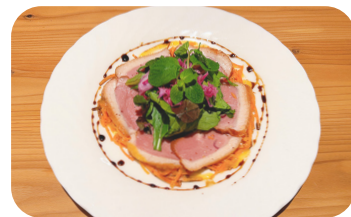
鴨のローストバルサミソース Roasted Duck with Balsamic Sauce ¥900