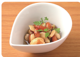
ハニーナッツ Honey Nuts ¥400