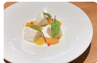
カマンベールチーズ Camembert Cheese with Orange Sauce ¥1,300