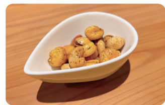
スパイシーミックスナッツ Spicy Mixed Nuts ¥500