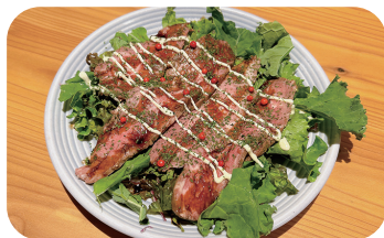
ローストビーフのカルパッチョ Roast Beef Carpaccio ¥1,200