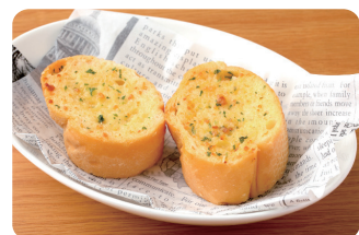
ガーリックバケット Garlic Baguette ¥360