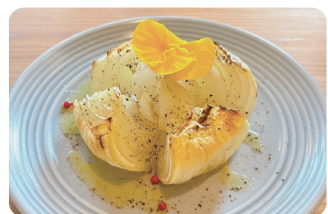
玉ねぎのオープン焼き Oven-Baked Onion ¥800