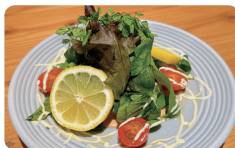
海老とアボカドのタルタル Shrimp and Avocado Tartar ¥800