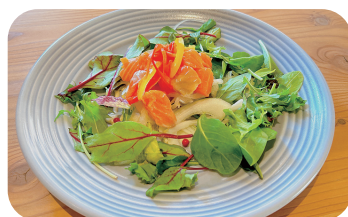
サーモンのマリネ Marinated Salmon ¥900