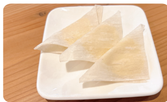
チーとろカマンベールチーズ Creamy Melted Camembert Cheese ¥500