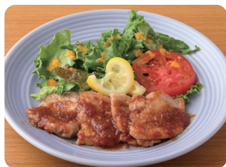
ジンジャーポーク Ginger Pork ¥1,120