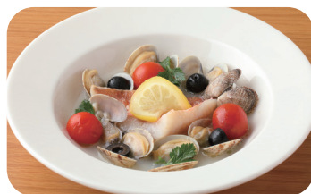
白身魚のアクアパッツァ Acqua Pazza with White Fish ¥1,200