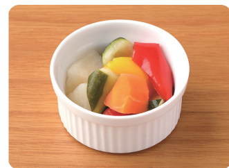
ピクルス Pickles ¥350