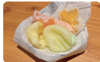
クルコップ Prawn crackers ¥300