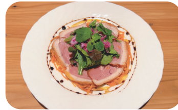
鴨のローストバルサミソース Roasted Duck with Balsamic Sauce ¥900