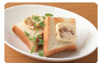
いちじくクリームチーズバタートースト Fig, Cream Cheese & Butter Toast ¥500