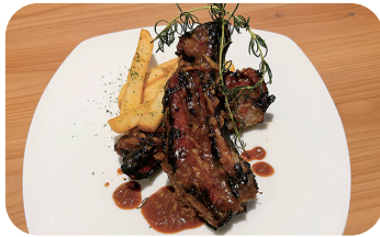
スペアリブポーク Pork Spare Ribs ¥1,600