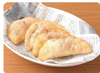
クリームチーズと生ハムのカリカリ揚げ Crispy Fried Cream Cheese and Prosciutto Rolls ¥500