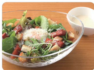
シーザーサラダ Caesar Salad ¥600