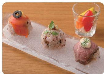
イタリアン風手まり寿司3種盛り、ピクルス添え Assorted Italian-Style Temari Sushi(3 Pieces) with Pickles ¥880