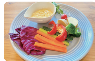
野菜のバーニャカウダ Vegetable Bagna Cauda ¥1,300