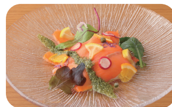
スモークサーモンカルパッチョサラダ風 Smoked Salmon Carpaccio-Style Salad ¥1,600