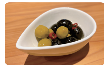
オリーブ Olives ¥300