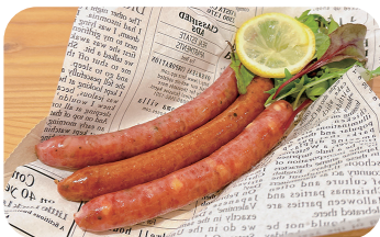
牛タン3種ウィンナー Assorted Beef Tongue Sausages (3 Types) ¥1,100