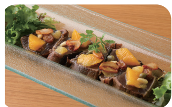
イタリア風かつおのたたき Italian-Style Seared Bonito (Tataki) ¥1,800