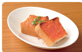
たらこトースト Cod Roe Toast ¥360