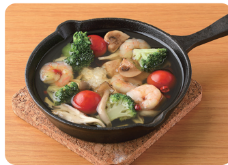
アヒージョ Ajillo (Garlic & Olive Oil Seafood) ¥1,600