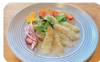
季節の白身魚のカルパッチョ Seasonal white fish carpaccio ¥1,300