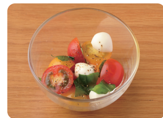
トマトとモッツアレラカプレーゼ Caprese (Tomato and Mozzarella Salad) ¥500