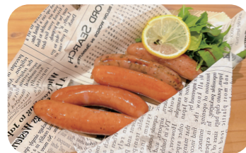
バラエティー粗挽きウィンナー5種 Assorted Coarsely Ground Sausages (5 Types) ¥1,100